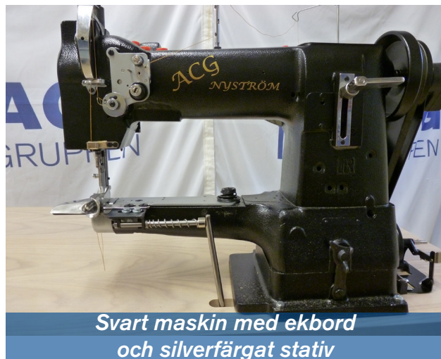
Svart maskin med ekbord och silverfärgat stativ