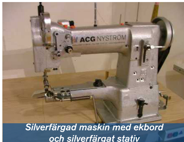
Silverfärgad maskin med ekbord och silverfärgat stativ