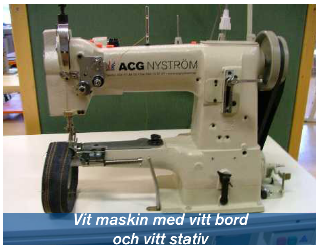
Vit maskin med vitt bord och vitt stativ