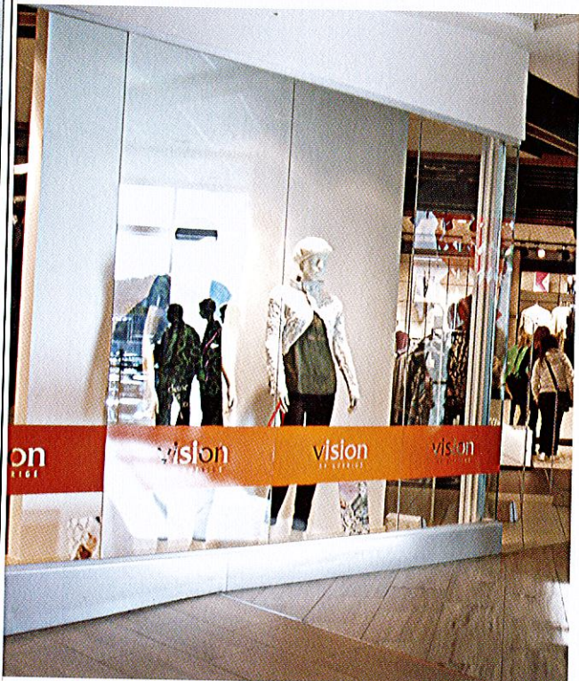
Inom loppet av ett år har Vision af Sverige öppnat elva butiker.

Trots företagsrekonstruktion och skulder på 28 miljoner kronor fortsätter Vision af Sverige att öppna nya butiker.